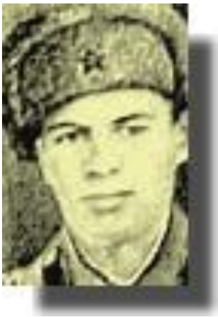
Мансур Гаязов (1917 – 1943)

Мансур Гаяз улы Гаязов 1917 елда хәзерге Мари АССРның Бәрәңге районы Бәрәңге авылында туа. Жиде классны төмамлаганнан соң, Бәрәңге педагогия техникумында белем ала, аннары Бәрәңге урта мәктәбәндә татар теле һәм әдәбияты укытучысы булып эшли.