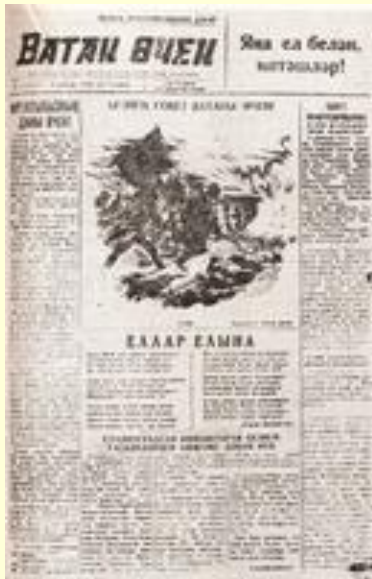
“Ватан өчен” исемле фронт газетасының бер бите. 1942 ел.