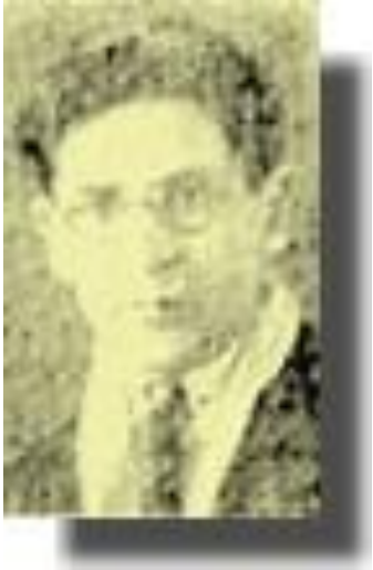
Нур Баян (1905 – 1945)

Нур Баян (Нур Галим улы Баянов) 1905 елның 5 маенда Татарстанның хәзерге Актаныш районы Әнәк авылында туа. 1921 елгы ачлык аны туган авылынан китәргә мәжбүр итә. Ул Пермь шәһәренә барып, кара эшче булып эшли, ә 1923 елда, укуын Казанга килә һәм Татар-башкорт хәрби мәктәбенә курсант итеп алына. Шушында укыганда аның әдәби иҗат эше башлана: авыл, гражданныр сугышы, илне саклау турында беренче шигырьләрен яза, һәм 1925 елдан аның исеме матбугатта инде бик еш күренә башлай. 1928 елда ул «Кызылармеец» дигән хәрби газета редакциясенә әдәби хезмәткәр булып урнаша һәм шул ук елда «Уракчы кызлар», «Кимерелгән окоплар» исемле ике шигъри җыентыгын бастыра.