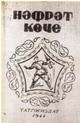
“Нәфрәт көче” альманахының титул бите