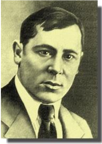
Муса Жәлил (1906 – 1944)

Татар халкының бөөк улы, герой шагыйрь Муса Жәлил (Муса Мостафа улы Жәлилов) 1906 елның 15 февралендә хәзерге Оренбург өлкәсе Шарлык районы Мостафа авылында дөньяга килә. 1913 елда Мусаның әтисе Мостафа абзый, ишле гаиләсен ияртеп, Оренбург шәһәренә күчә.